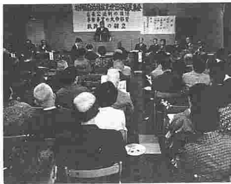
熱心に講演を聞く人たち

えすぎて仕事がかまうまいかという例が、違反建築の取締り、公害対策など多くの面で見られます。こういった身近な住民生活に関する仕事は、早急に区に移管した方がうまくいくことが多いと考えられます。