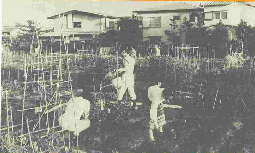
家族で楽しめる区民農園。あなたも野菜を作ってみませんか。 写真：祖師谷区民農園にて。

昭和55年第一回臨時議会が、5月15日から19日まで五日間の会期で開かれた。 初日の本会議で、区長から提案のあった工事請負契約十三件と専決処分の承認一件の議案が上程され、担当の委員会に付託した。 最終日の本会議では、委員会審査が終わった議案を全員賛成で可決。また、追加提案のあった監査委員の選任についても同意した。そのほか、議長、副議長の辞任に伴う選挙が行われ、新しい正副議長が決まった。常任・特別委員会の正副委員長の一部も改選され、それについての報告があった。 委員会構成等については裏面に掲載