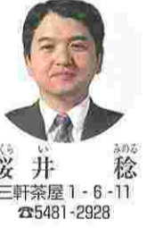
稔 井 桜 三軒茶屋 1-6-11 ☎5481-2928