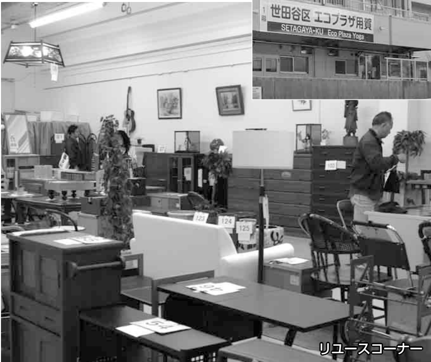
リユースコーナー