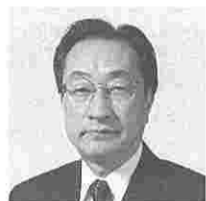
市川康憲 (いちかわやすのり) (公明)