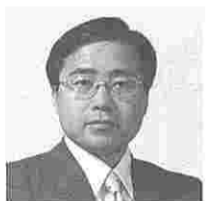
板井 斎 (いたいひとし) (公明)