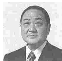
岩本激昌 (いわもとすみまさ) (公明)