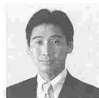
稲垣まさよし (いながまさよし) (民主)