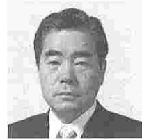
飯塚和道 (いづかかずみち) (公明)