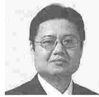
高橋昭彦 (たかはしあきみち) (公明)