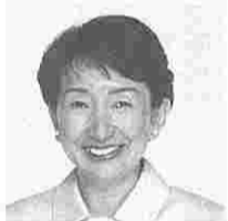
栗林のり子 (くりばやしりのこ) (公明)