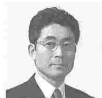
大場康宣 (おおばやすのぶ) (自民)