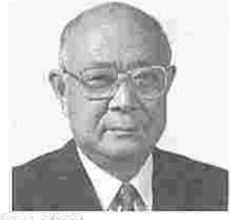
長谷川義樹 (はせがわよしき) (公明)