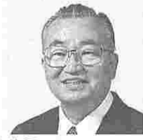
平山八郎 (ひらやまはちろう) (自民)