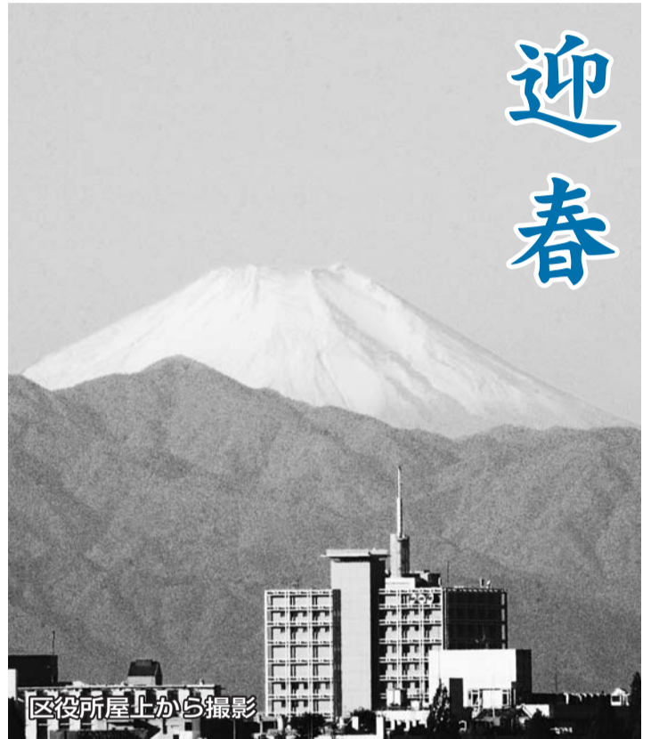
区役所屋上から撮影