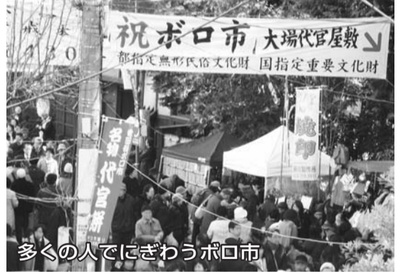
多くの人でにぎわうボロ市

日本共産党区議団は、区民税の軽減など区民への負担軽減に取り組み、区議会として「低所得者への負担軽減等を求める決議」を可決するとともに、食料価格高騰への対策として学校給食の食料費への無利子融資を実現させました。今年さらさら国保、介護などの負担軽減を拡充させます。 経済的な格差が教育に影響を及ぼしています。子どもの未来のために就学援助と奨学金制度の拡充に取り組みます。区の基金、70億円を活用すれば実現できます。