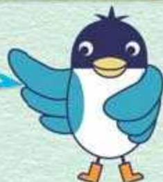
あんすこ君 あんしんすこやかセンター イメージキャラクター