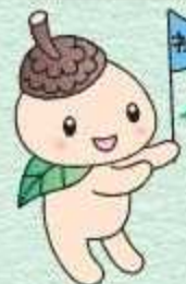
ココロン 世田谷区社協 キャラクター

社会福祉協議会は、誰もが地域で安心して住み続けられるよう住民の皆さまと共に、福祉のまちづくりを進めています。