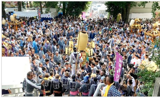
9月3日(日) 宮入りの様子

9月2日(土)、3日(日)北澤八幡神社の例大祭が執り行われました。今年の見どころは、なんとと言っても4年ぶりの神輿の宮入りです。境内に八つの睦会の神輿と担ぎ手が集結し、大迫力の瞬間でした。