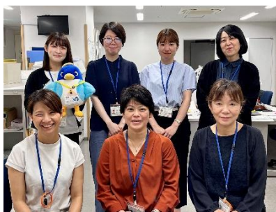
8月現在、7名の職員で活動しています！

当センターでは、年齢を重ねても、自分らしく地域で生活するための様々な支援を行っております。今回は、2つの事業をご紹介します。