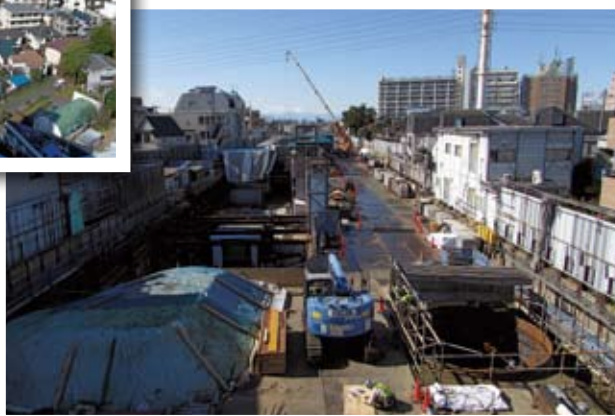
世田谷代田駅付近から 小田原方向（地下化後）