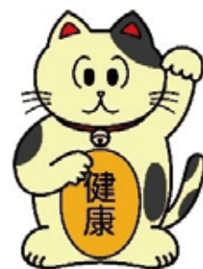
”北沢健康まねきの会” のキャラクター