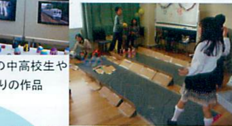
小さな子どもたちと遊ぶ「キッズコーナー」は中学生たちが考えた手作りの遊びがいっぱい ペットボトルボーリング