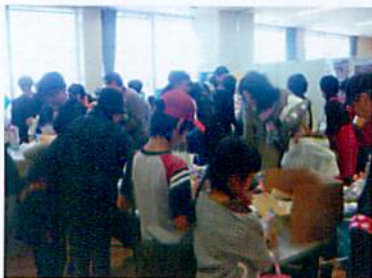
ーチャリティーバザーのにぎわい