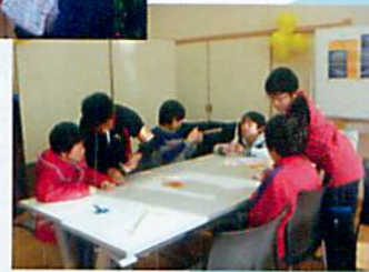
わりばし鉄砲の作り方を教える中学生ボランティア