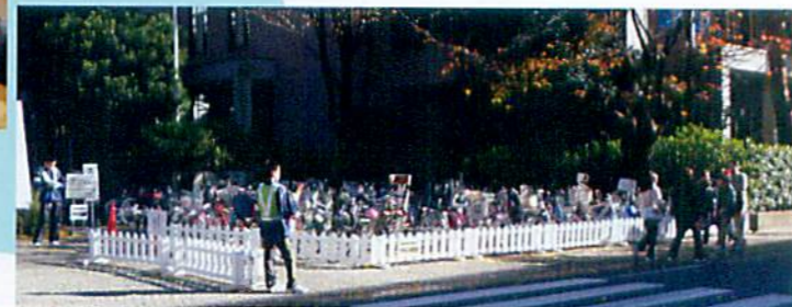
成城学園が敷地の一部を貸してくれました