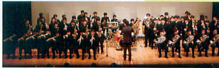
庄巻の都市大付属中高吹奏楽部