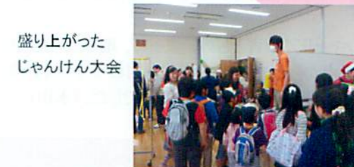
盛り上がった じゃんけん大会