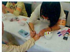
フェイスペイント 手にも描きます