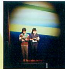
司会の中学生 もちろん 照明・音響も中学生