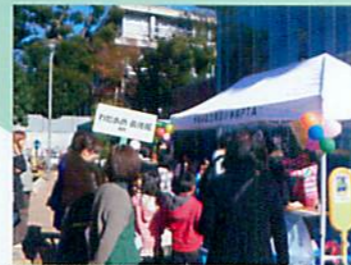
成城さくら児童館のわたあめ機で中学生たちはがんばっています 大人気で長蛇の列