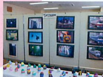
展示コーナーには地域の中高校生やアルテンハイムのお年寄りの作品