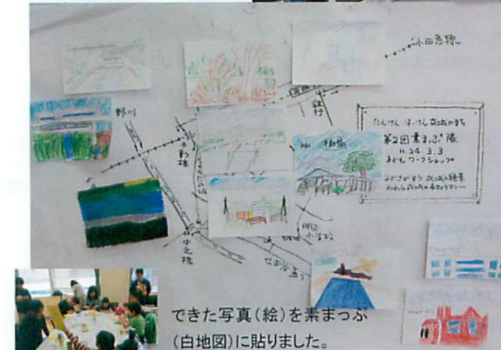
できた写真(絵)を素まつぶ(白地図)に貼りました。