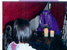
大人気の占いコーナー 実はベテラン委員が子どもたちの小さな相談に親切に答えています