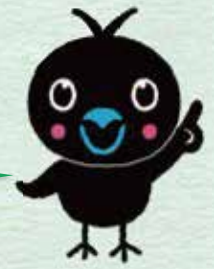
からぴょん 烏山地域キャラクター