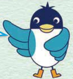
あんすこ君 あんしんすこやかセンター イメージキャラクター