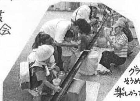
児童館のグラウンドで流しぞうめんをしました! 楽しかったね~😊

😊 同世代(2~3歳)のお子さんを育てる保護者同士 みんなで楽しく活動しましょう♡