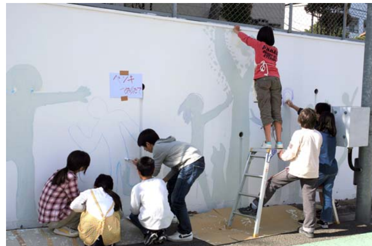
千歳台小30周年記念壁画作成中の様子