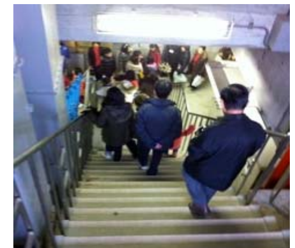
葎根公園の給水施設の階段を降りていくと、大きな給水槽が！