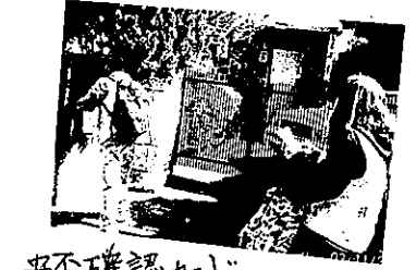
安否確認カード掲出訓練