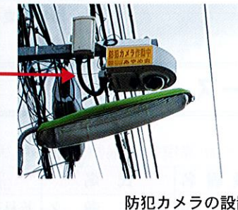
防犯カメラの設置