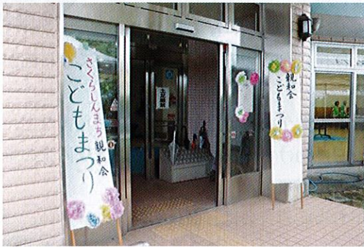
桜新町親和会「こどもまつり」

この節目にこれまでの100年を振り返りつつ、これからの10年、20年を見据えた活動を進めていきます。地域の皆さま同士がふれあい、さまざまなコミュニティを形成することで、より一層の安心・安全なまちづくりを実現できるよう努めてまいります。