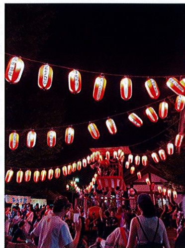
賑わう夏の夜、納涼おどり大会

町会活動は一部の人の力では続きません。誰もが関わり、顔が見える関係を築くことで、地域のつながりが強くなると感じています。これからも「参加したい」と思える町会になることを願い、活動していきたいと思っています。