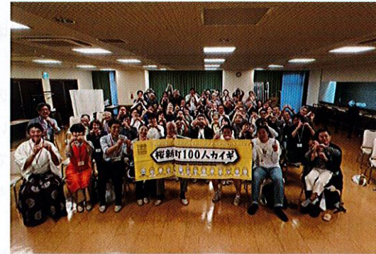
「桜新町100人カイギ」登壇者と参加者