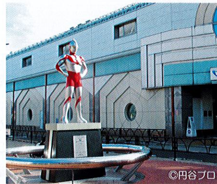
祖師ヶ谷大蔵駅前広場のウルトラマン像