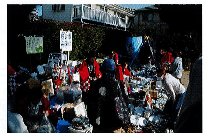
「上馬公園自然と親しむフェスタ」でのリサイクル活動