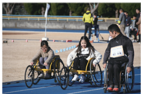
▲車いすレーサー体験の様子

令和6年度は、誰もがスポーツに親しむ環境づくりとして、「バラスポーツ普及啓発物品」の作成や、「ボッチャボールセット・レフェリーキット」など、バラスポーツ用具貸出物品の購入に活用しました。