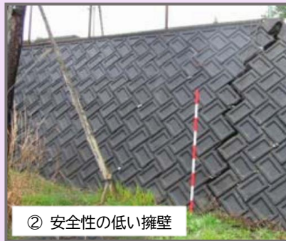
② 安全性の低い擁壁