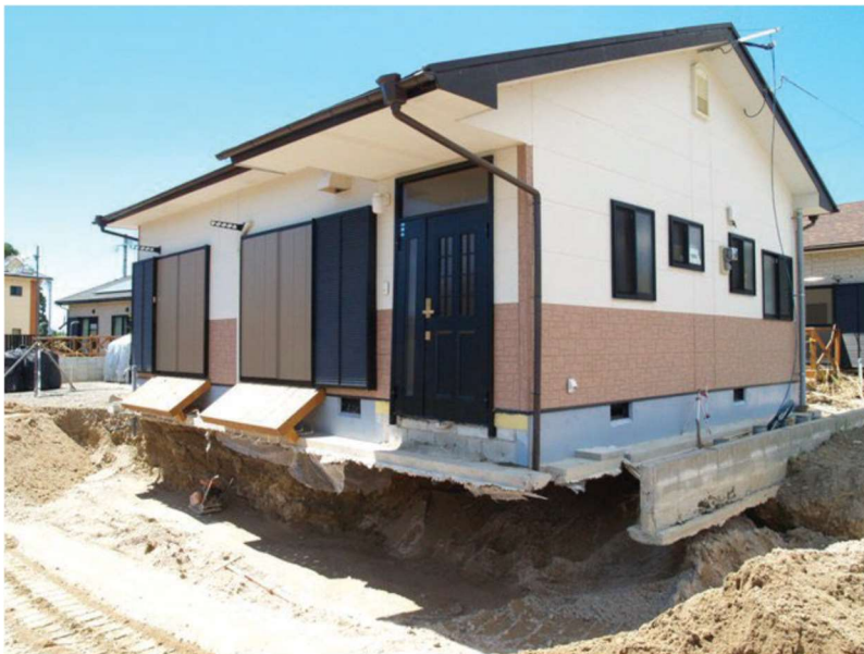
「内閣府資料より」 地盤の流出