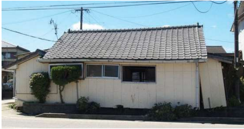
「内閣府資料より」 傾斜が発生