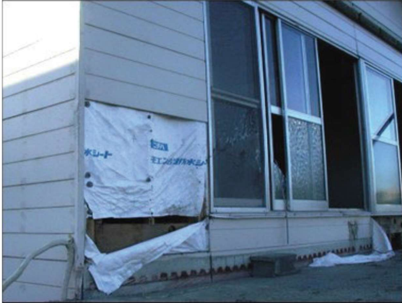
「内閣府資料より」 仕上げ材の脱落、ボードの脱落