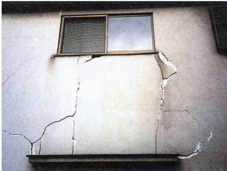
公益財団法人日本住宅・木材技術センター