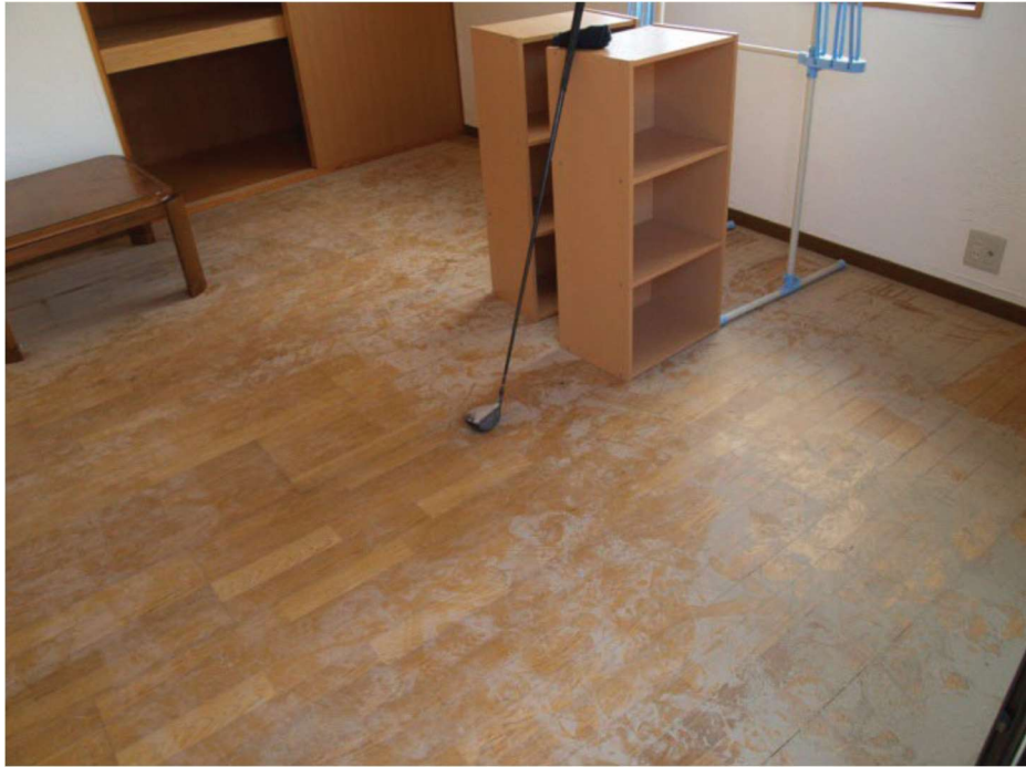
「内閣府資料より」 浸水による床の汚損