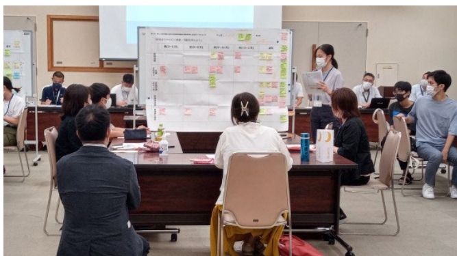
▲グループワークの内容は、ワークショップの最後に他のグループの方々に向けて発表していただきました。発表者のみなさん、ありがとうございました！