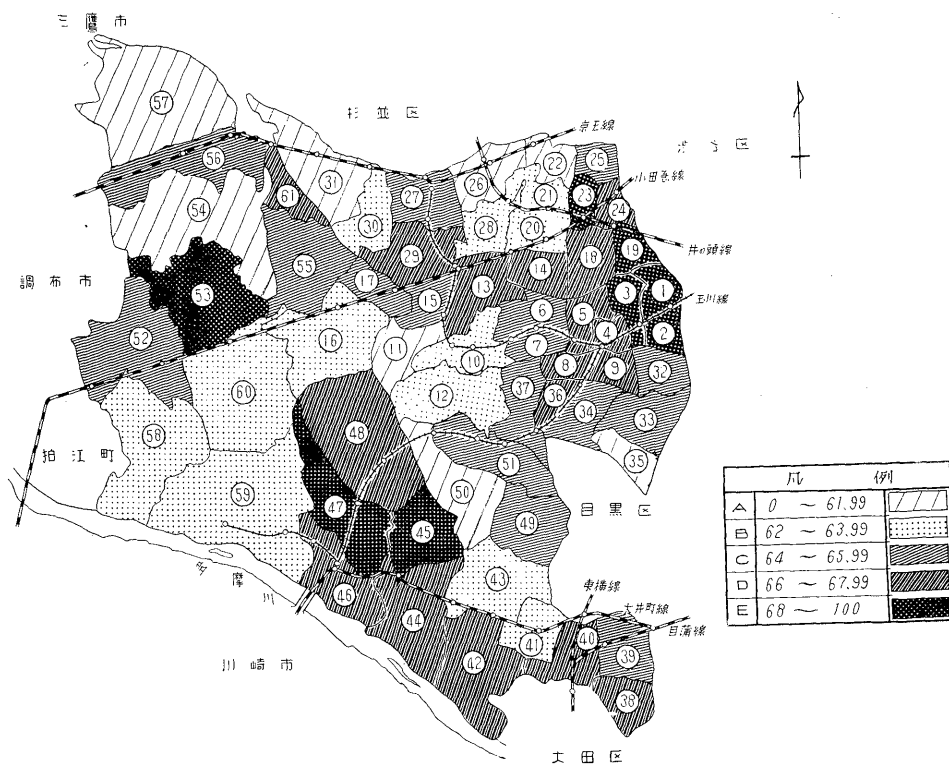
第 1 図 投票 区 別 投票 者 数 (昭和35年執行衆議院議員選挙投票率)