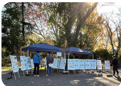
パネル展示・アンケート