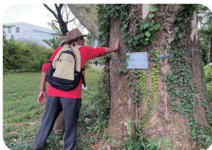
五感で楽しもう 緑地散策スタンプラリー