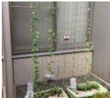
グリーンカーテン