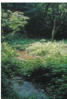
神明の森みづ池の湧水

斜面地やその周辺には樹木が茂り森の様相を呈しています。それらの樹木は、元々、里山の雑木林として利用されてきたコナラ、クヌギ、イヌシデ等の落葉広葉樹が中心であり、新緑や黄葉等の季節の変化を感じる武蔵野らしい緑地帯となっています。また、松林やスダジイ等の常緑樹が場所ごとに混在し、多様な樹木から構成されています。