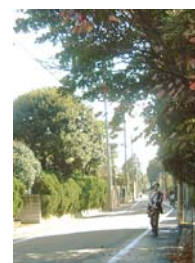
成城三丁目界わい

江戸時代から農村としての歴史がある場所ですが、鉄道の開通とともに住宅地へとかわってきました。大正から昭和初期にかけては、財界人等の別荘が岡本から上野毛近辺にいくつも建てられました。