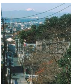
岡本三丁目の富士見坂

国分寺崖線の斜面にそって、いくつもの坂があり、長年にわたって親しまれてきた坂には名前がつけられています。