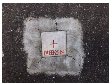
(アルミセットパイル製)