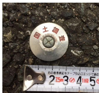
図根多角点本点(Φ50mm) 図根多角点(Φ50mm) 細部図根点【二次】(Φ30mm)