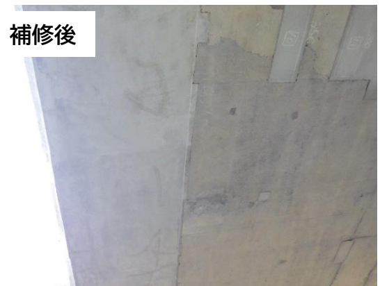
断面修復 (鉄筋が露出した箇所を補修)