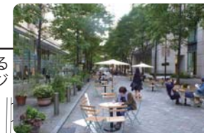
緑陰を感じられる広場空間イメージ