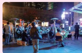
駅前広場でのイベントイメージ