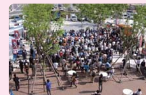
駅前広場でのイベントイメージ