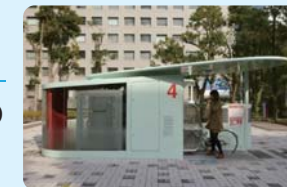
地下式駐輪場イメージ