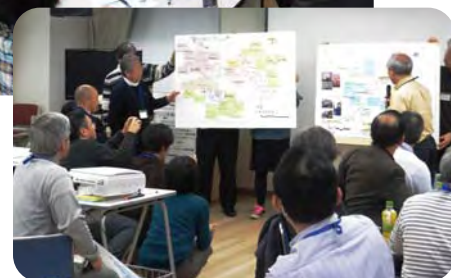
ワークショップの様子（写真上）とグループ発表の様子（写真下）