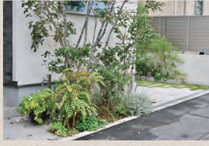
玄関先の花木のお手入れ