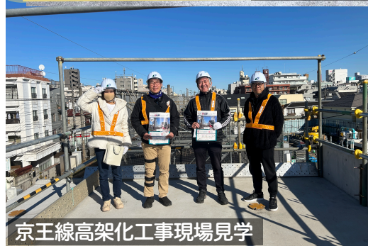
京王線高架化工事現場見学