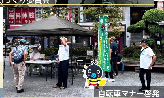
自転車マナー啓発