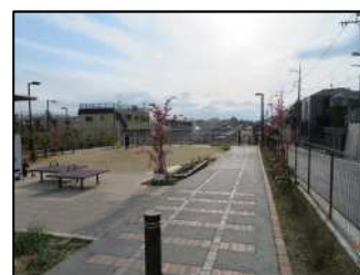
代田富士 356 広場