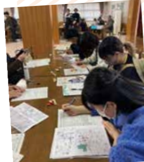
まちあるき後はふりかえり