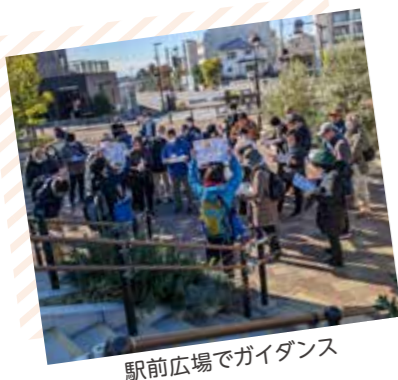
駅前広場でガイダンス