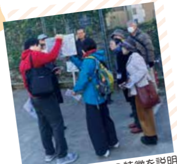
ポイントごとにまちの特徴を説明