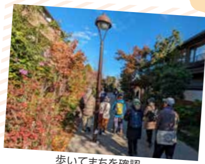
歩いてまちを確認