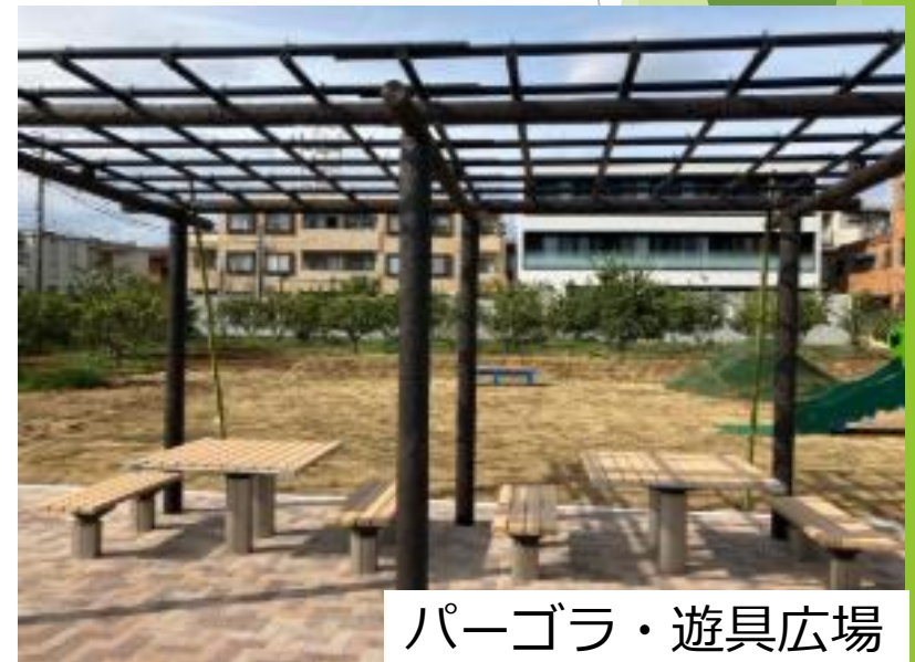
パーゴラ・遊具広場