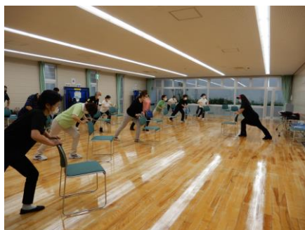
「楽しく体操」で元気に楽しく活動しましょう