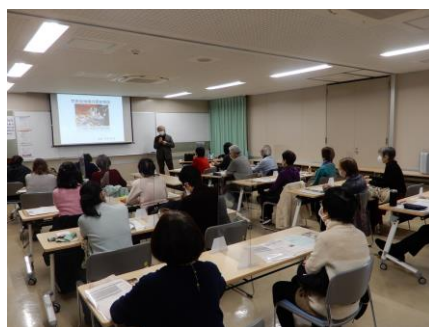
「世田谷の歴史」から「宇宙」まで幅広いジャンルの講義