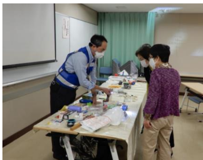
いざという時のため知っておきたい「防災・減災」