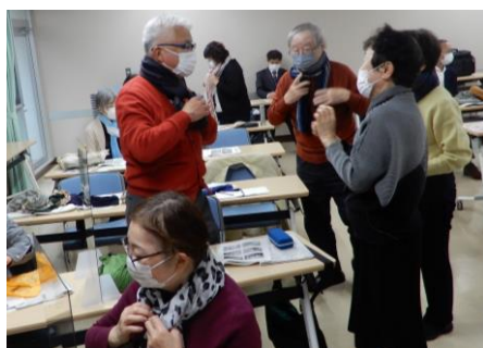
5歳若返るファッション講座で心も前向きに