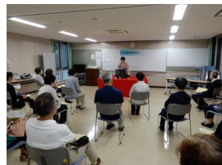
セミナーで初めて鑑賞してハマる人も多い「講談」