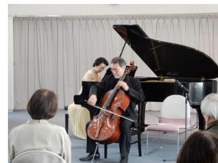
素晴らしいチェロとピアノの演奏に癒されます