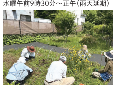
▲草刈りしながら楽しくおしゃべり