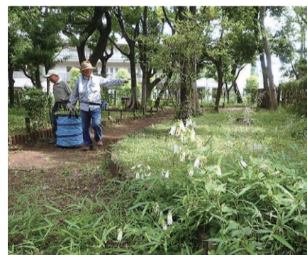
▲生きものが集まる明るい草花をめぐりながら