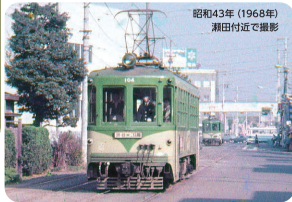
昭和43年(1968年) 瀬田付近で撮影