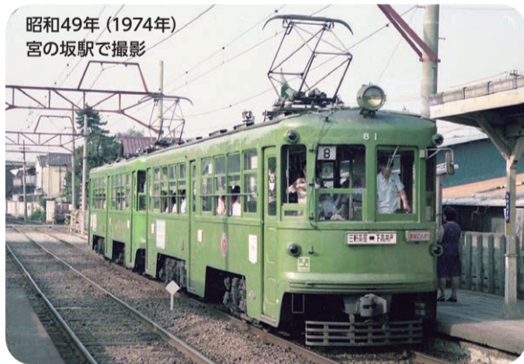
昭和49年(1974年) 宮の坂駅で撮影