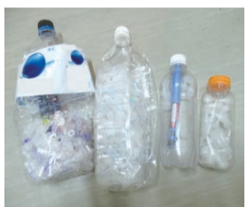
不適切な排出例(工場で見つかった注射針が入ったペットボトル)▶