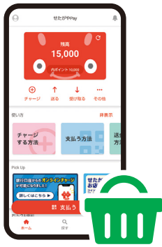
① 普段通り、 せたがやPayで お買物