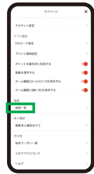
④ 抽選一覧を タップ