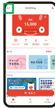
③ アプリの マイページを開く