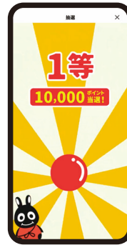
⑦ 抽選結果を確認 (右上の×をタップすると ホームに戻ります)