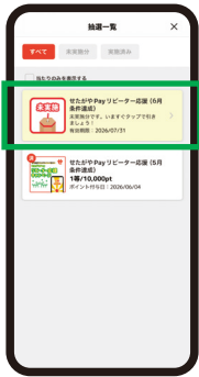
⑤ 抽選チケットを タップ