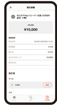
⑧ 当選した場合、 ポイントは即時付与されます (詳細は取引履歴からも確認できます)