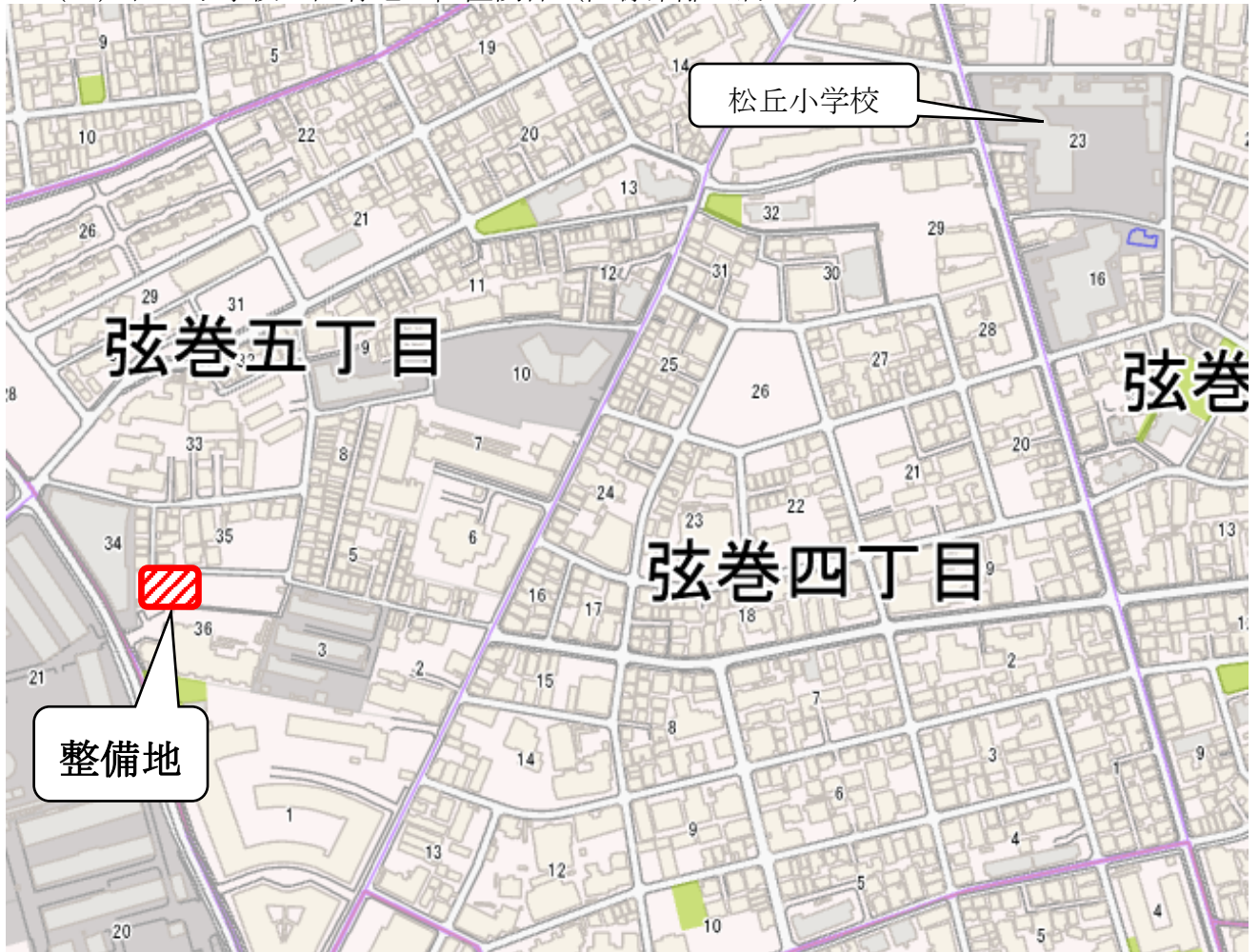
(3) 松丘小学校と区有地の位置関係（直線距離で約 650m）

なお、放置自転車等保管所との境界部分には、新たに警報システム付きのフェンスを設置する必要があることから、事業者において施設の躯体工事と併せて既存工作物等の解体撤去及びフェンスの設置を行うこととする。なお、当該解体撤去及び設置等に要する費用は、区が負担する。