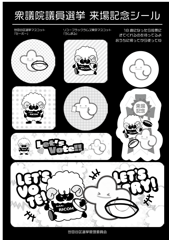
オリジナルシール