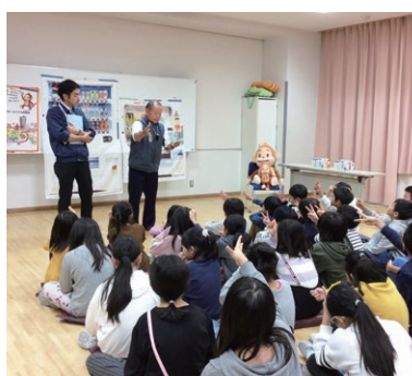
1 小学校へ出張講座