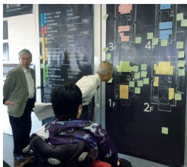
4 建物整備へのアドバイス