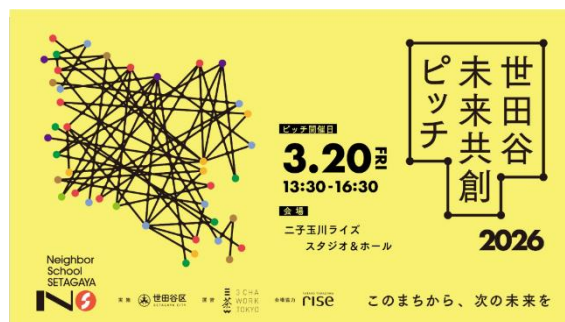
コース受講者によるピッチイベントチラシ