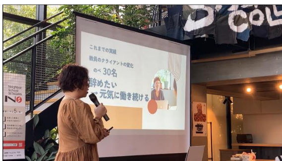
コース受講者によるピッチの様子