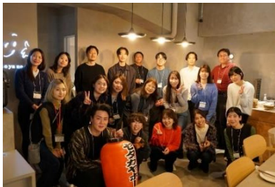
「やおやのファミリーレストラン」

参加者同士の新たなビジネスや事業に繋がる交流促進を目的に、区内の飲食店等を活用してカジュアルに参加できる交流会を定期開催した。令和7年度は引き続き区内飲食店や場を運営する区内事業者とも連携を図り、開催場所のオーナー等に事業紹介や、地域で取り組みたいことの共有、協業の促進を図った。(計10回、合計250名参加)