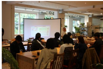
「Marked 池尻」(HOME/WORK VILLAGE 内店舗)