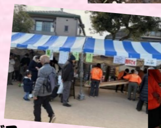
売店・湯茶サービス (協力:町会・自治会 及び日赤奉仕団梅丘分団) 2月7日～3月1日