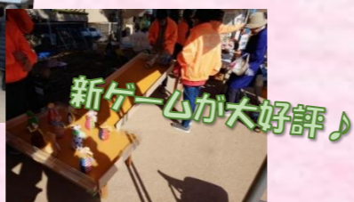
新ゲームが大好評♪ ごみ減量・リサイクル 推進委員会ブース 2月21日