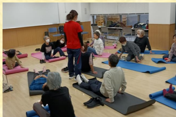
健康づくり教室 2月24日 主催:健康部会