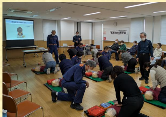
普通救命講習 2月16日 主催:安全部会