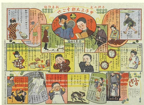
こうこじょうたるう 甲子上太郎すごろく 大正 5 年 (1916) 北沢楽天画