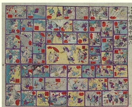
とうかいどうごじゅうさんえき こっけいどうちゅうすごろく 東海道五十三駅 滑稽道中双六 明治 19 年 (1886) 頃 河鍋暁斎筆

会場内で実際に遊べるように「友子の空想旅行双六」大正 8 年（1919）の複製を用意しました。奇想に満ちた楽しいすごろくです。主人公の「友子」が飛行機煎餅に乗って旅に出ます。「上り」はどこでしょう？……サイコロをふって確かめてみませんか。