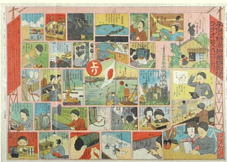
らちオ双六 大正 15 年 (1926) 原田三夫・本間清人・中島俊吉共作