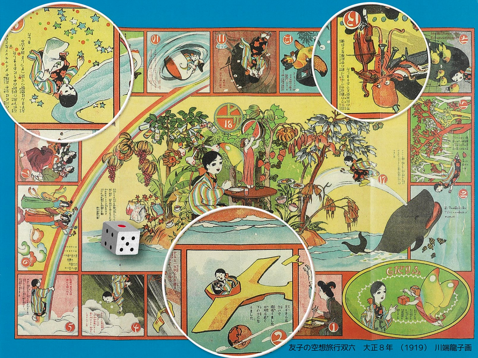
友子の空想旅行双六 大正8年（1919）川端龍子画