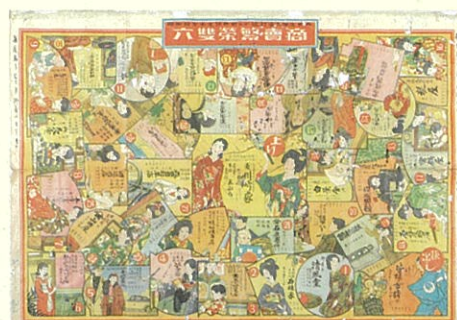
しょうわじゅういちねんどちやうふまちおよ 昭和拾壹年度調布町及び近村優良商店案内 しょうばいはんじやうすごろく 商売繁盛双六 昭和 10 年 (1935)

世田谷デジタルミュージアム https://setagayadigitalmuseum.jp/