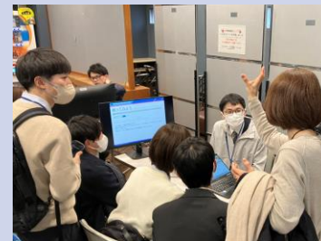
(SETAGAYA DX Awardでの活動の様子)