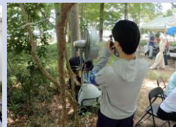
採用されて1年目なので分からないことが多かったり。