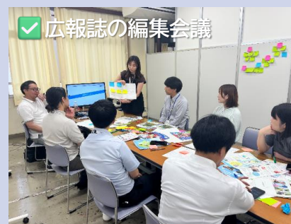
✓ 広報誌の編集会議