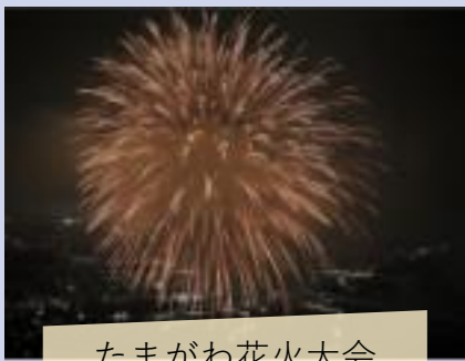
たまがわ花火大会