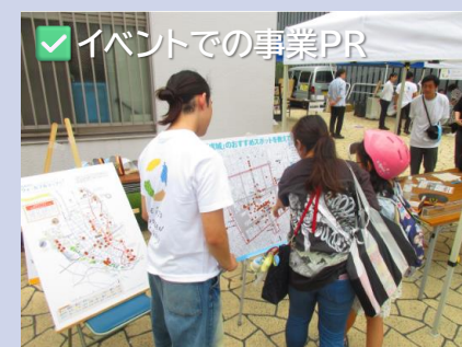
✓ イベントでの事業PR