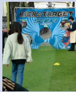
スフィード世田谷FC