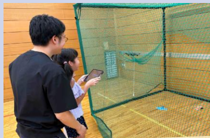
烏山児童館体験イベント