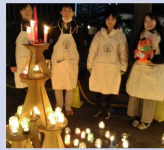
キャンドルタワー・PTメンバー