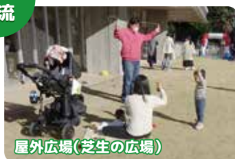
屋外広場(芝生の広場)