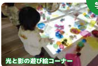
光と影の遊び絵コーナー