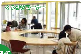
くつろぎコーナー