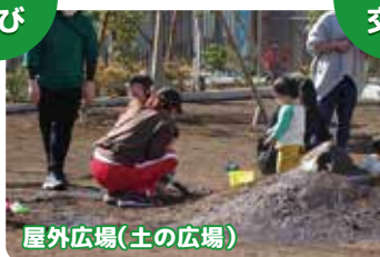
屋外広場(土の広場)