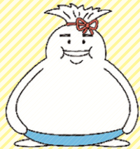
世田谷区のごみ減量に向けたイメージキャラクター ヘラソ