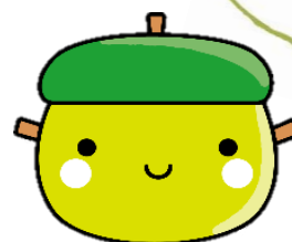
せたがや離乳食研究員 モグモ