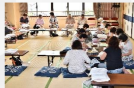
社会奉仕のボランティアで、みんなで雑巾を縫いました。