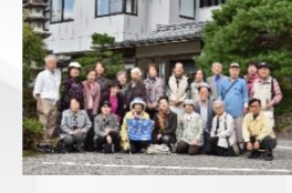
研修旅行もありますよ。

ミニディでは友愛活動の一環として椅子に座って体操したり、お弁当を食べたり、カラオケしたりします。